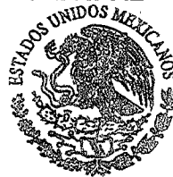
C. ANA CECILIA RIVERA JIMENEZ

CONTRALORIA MUNICIPAL TECOMATLAN PUEBLA 2021 - 2024